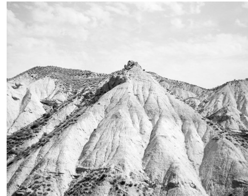
Figura 2. Kela Coto (s.f.) Estudio para la creación de una montaña [fragmento]. Fotografía