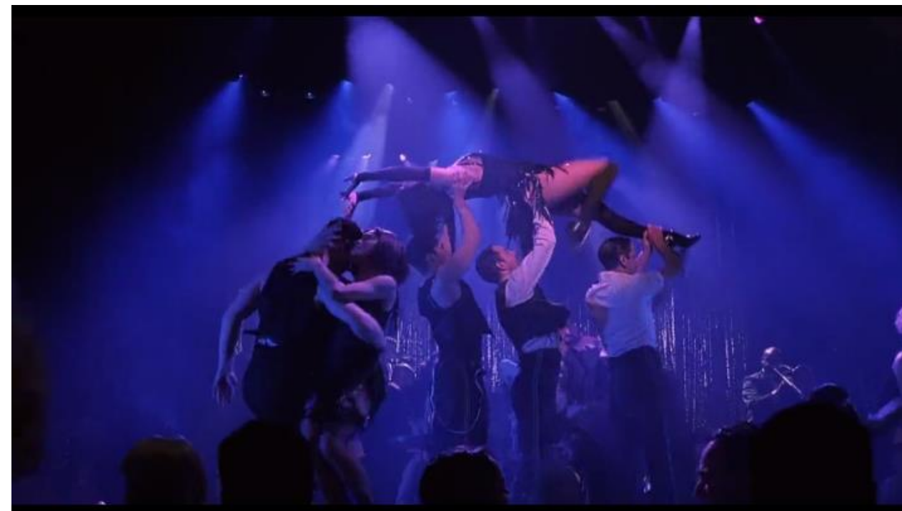
Fotograma de la película Chicago (2002). Dir. Rob Marshall