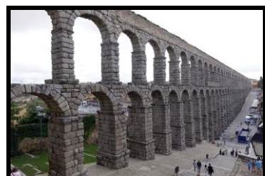
Acueducto de Segovia