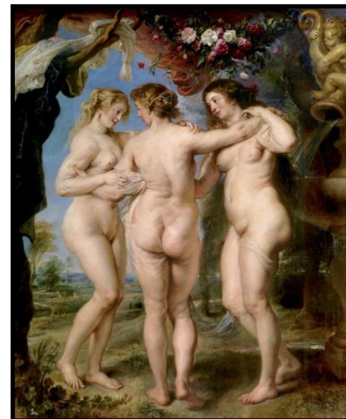
Las Tres Gracias, Rubens