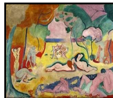
La alegría de vivir, Matisse

Es construida para la Exposición Universal de París de 1889.