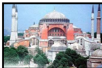
Santa Sofía de Constantinopla