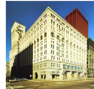
PREGUNTA 6. B

PREGUNTA 7.A: “Centro acuático de Londres” de Zaha Hadid. Señale su cronología aproximada y las principales innovaciones de la obra de esta arquitecta. (1 punto)