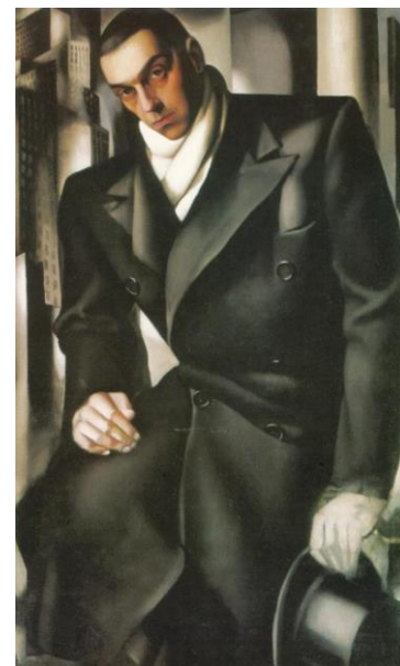
PREGUNTA 4. B

PREGUNTA 5.A: “Mona von Bismarck”, retrato de Cecil Beaton para la revista Vogue. Explique brevemente las características de la fotografía esteticista. (1 punto)