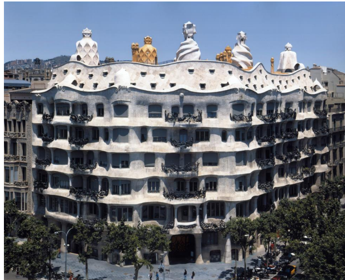
PREGUNTA 3. A

PREGUNTA 3.B: “Las tres gracias”. Señale su autor, cronología aproximada y describa las principales características de la escultura neoclásica. (1 punto)