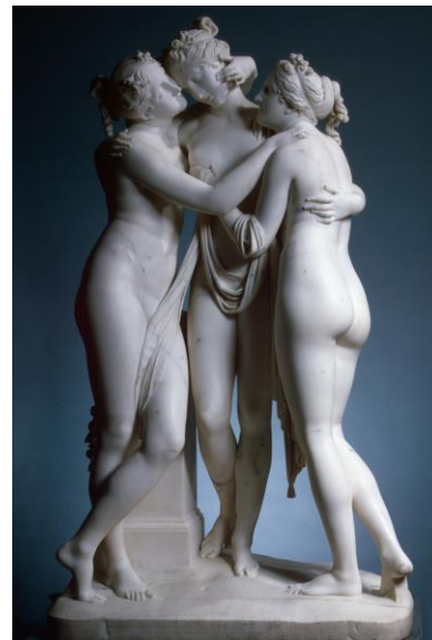
PREGUNTA 3. B

PREGUNTA 4.A: “Broche Flamenco” de Cartier. Señale las principales aportaciones de Cartier a la renovación de la joyería y su relación con el Art Decó. (1 punto)