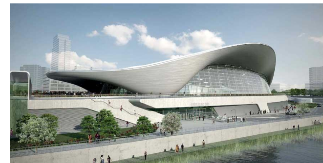
PREGUNTA 7. A

PREGUNTA 7.B: Identifique la película a la que pertenece este fotograma y su productora y explique los recursos de animación que utiliza. (1 punto)