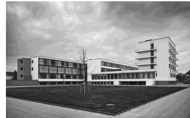
PREGUNTA 6. A

PREGUNTA 6.B: “Auditorium de Chicago” de Louis Sullivan. Señale su cronología aproximada y explique las características fundamentales de la arquitectura funcional. (1 punto)