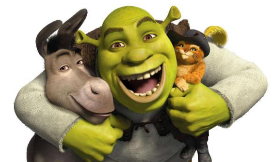
PREGUNTA 7. B