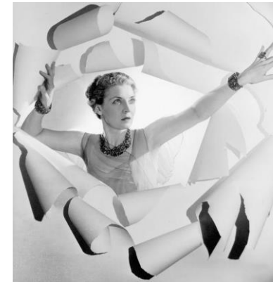
PREGUNTA 5. A

PREGUNTA 5.B: “Figura reclinada”. Señale su autor y cronología aproximada y explique las características de la escultura biomórfica de este escultor. (1 punto)