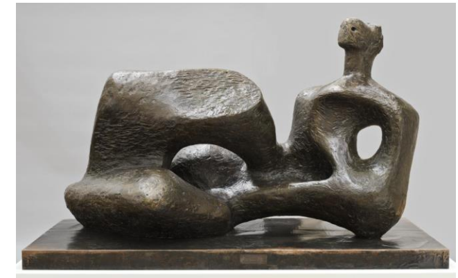
PREGUNTA 5. B

PREGUNTA 6.A: “Edificio de la Bauhaus” de Walter Gropius. Explique cuáles son las características principales de la Escuela alemana de la Bauhaus. (1 punto)