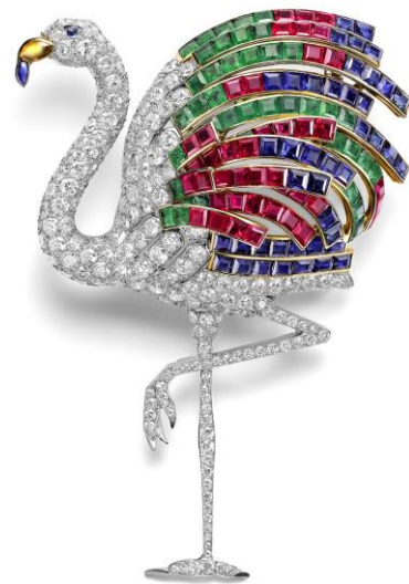
PREGUNTA 4. A

PREGUNTA 4.B: “Retrato de hombre inacabado” de Tamara de Lempicka. Señale su cronología aproximada y las características del lenguaje plástico de esta autora. (1 punto)