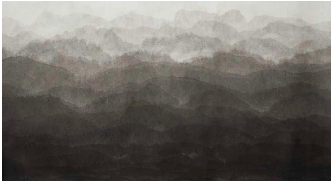
Figura 1. Minjung Kim (2017) Montaña . Dibujo con tinta sobre papel.