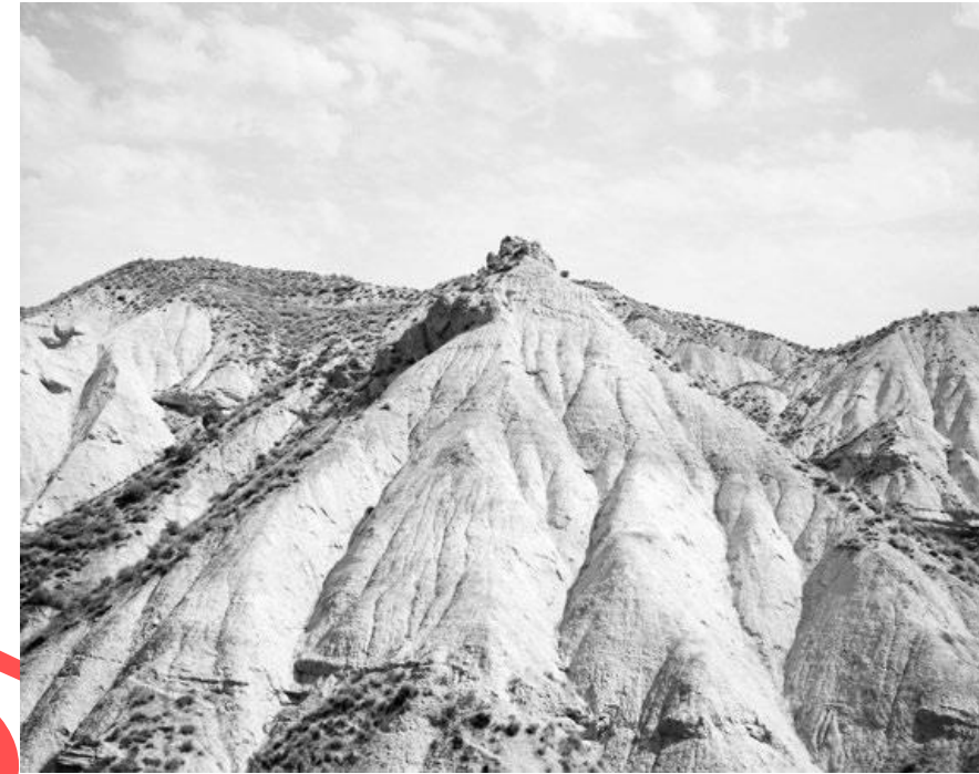
Figura 2. Kela Coto (s.f.) Estudio para la creación de una montaña [fragmento] Fotografía.