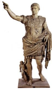
Augusto Prima Porta