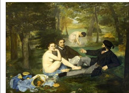
Almuerzo sobre la hierba