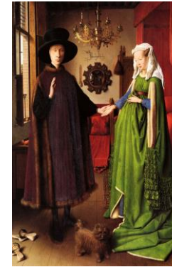
El Matrimonio Arnolfini