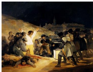
Los fusilamientos de la Montaña del Príncipe Pío o el 3 de Mayo en Madrid