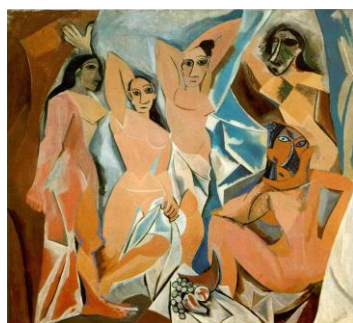
Las Señoritas de Avignon