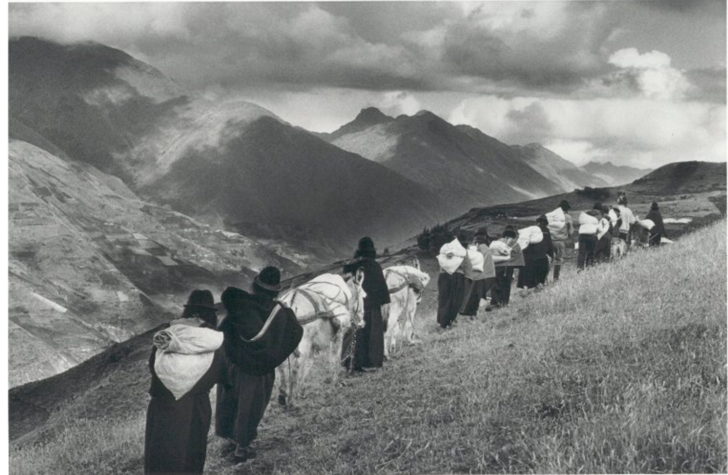
Sebastião Salgado "Exodo"