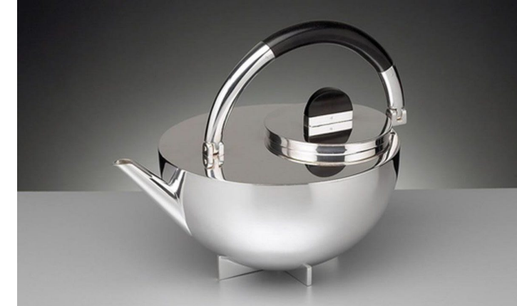
Imagen preguntas 16 y 17

Pregunta 15 Explique las principales características del movimiento y nombre a otros dos artistas de este. (1 punto)