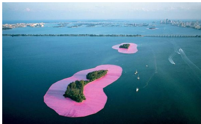
Imagen preguntas 4 y 5

Pregunta 3 Explique el carácter precursor de este movimiento artístico. (1 punto)