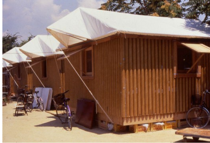
Imagen preguntas 11 y 12

Pregunta 11 “Arquitectura de emergencia”. Indique el nombre del/la autor/a y cronología aproximada. (1 punto)