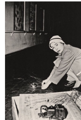
Imagen preguntas 18 y 19

Pregunta 17 Explique las principales aportaciones y relevancia de esta escuela en la historia del diseño. (1 punto)