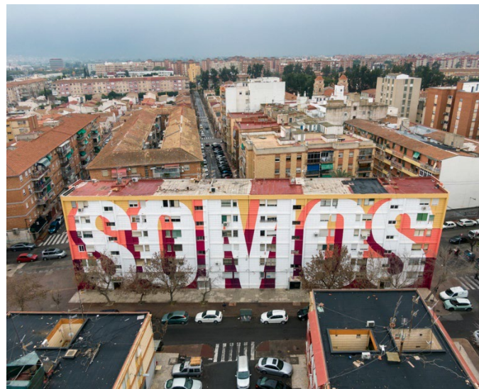
Imagen preguntas 13, 14 y 15

Pregunta 12 Explique las principales aportaciones de la obra a la arquitectura desde una perspectiva social. (1 punto)