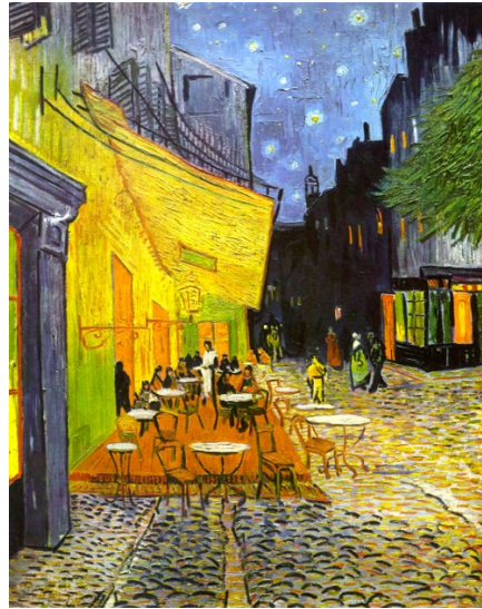
Imagen preguntas 1, 2 y 3

Pregunta 1 Indique el título, autor/a de la obra y cronología aproximada. (1 punto)