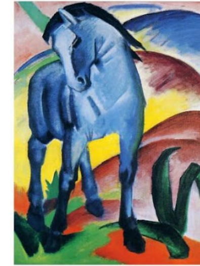
Imagen preguntas 6, 7 y 8

Pregunta 5 Identifique el movimiento artístico al que pertenece y explique las principales características de este. (1 punto)