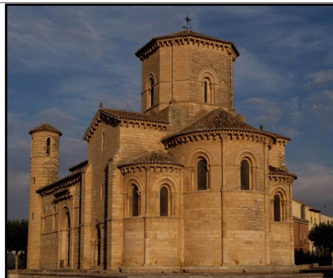
PREGUNTA 3 (2 puntos)