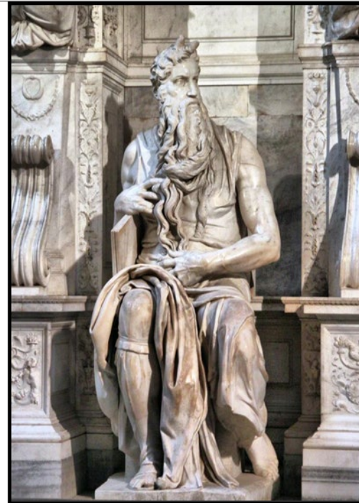
PREGUNTA 6 (2 puntos)