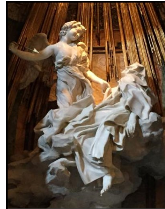
PREGUNTA 7 (2 puntos)