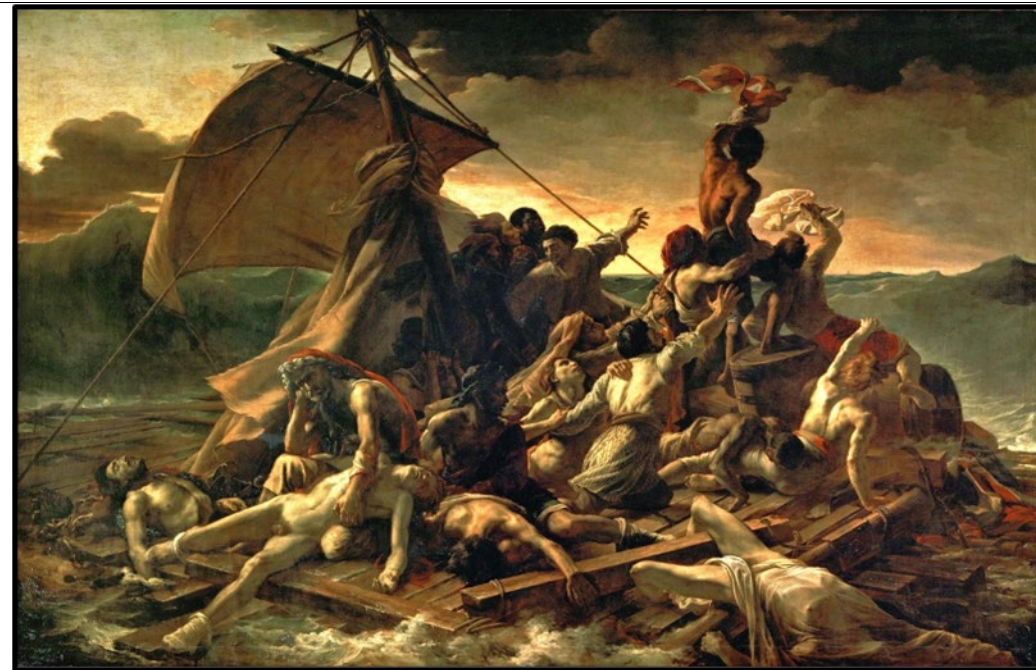
PREGUNTA 8 (2 puntos)