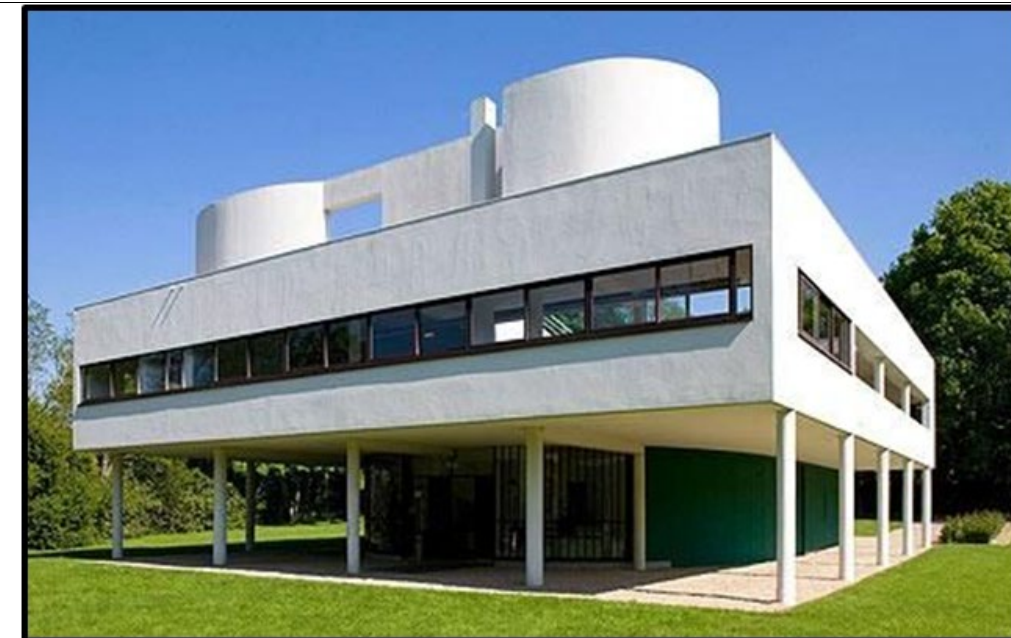
PREGUNTA 9 (2 puntos)