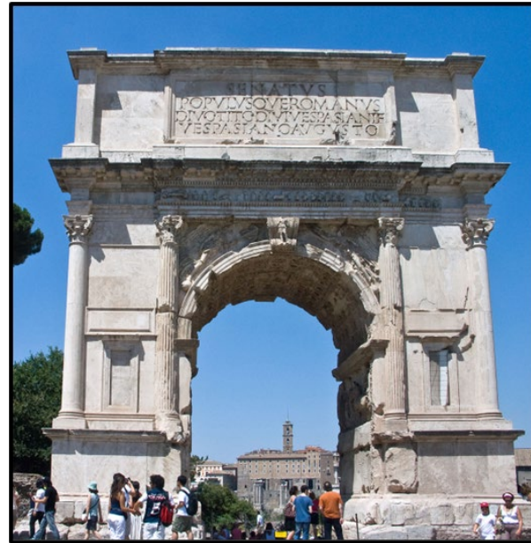
PREGUNTA 1 (2 puntos)