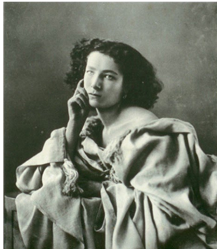
(Imagen pregunta 11)

PREGUNTA 12 “Mujer y libélula” de Lluís Masriera. Describa esta tipología de la joyería modernista. (1 punto)