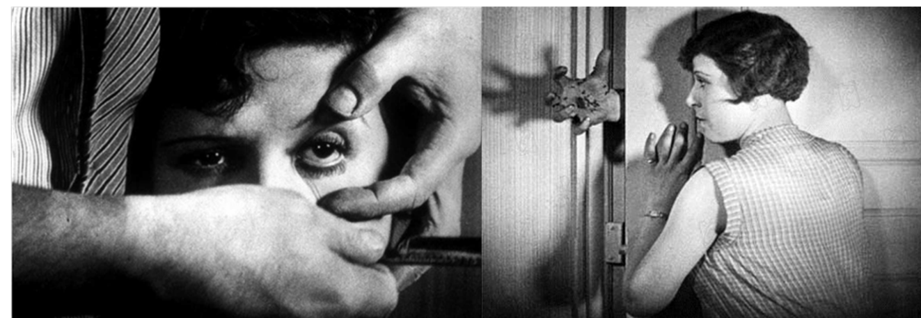
(Imágenes preguntas 9 y 10)