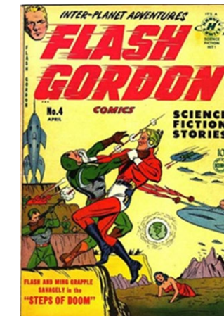
(Imagen pregunta 16)

PREGUNTA 17 Silla Wassily (1925), de Marcel Breuer. Explique los principios del diseño industrial de la Bauhaus. (1 punto)