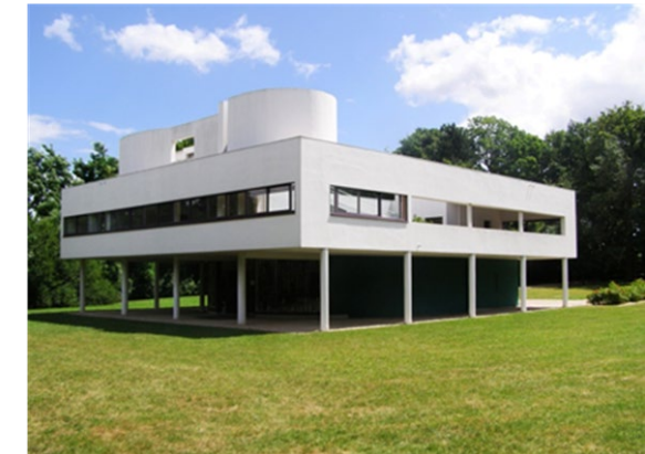
(Imagen pregunta 18)

PREGUNTA 19 Fotograma de la película “Mujeres al borde de un ataque de nervios” (1988). Identifique al director y explique sus recursos cinematográficos. (1 punto)