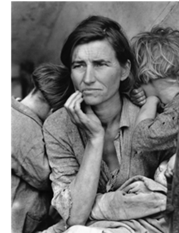
(Imagen pregunta 15)

PREGUNTA 16 “Flash Gordon”, personaje creado por Alex Raymond en 1934. Describa las claves sociológicas y estéticas del cómic de súper héroes americano. (1 punto)