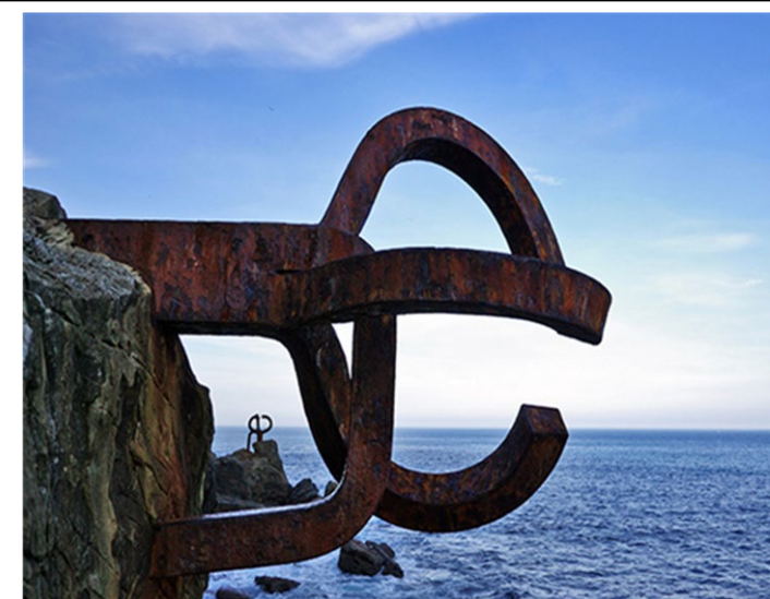
(Imagen preguntas 7 y 8)