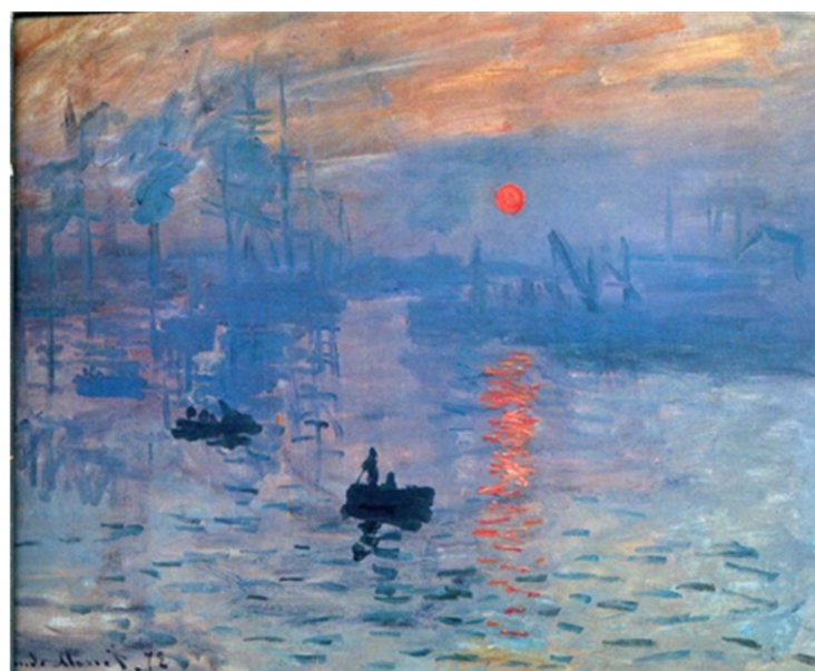
(Imagen preguntas 4, 5 y 6)