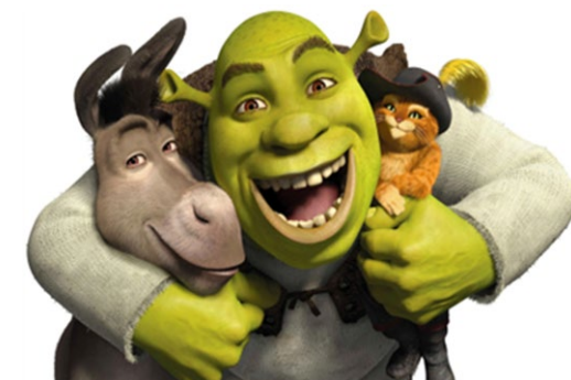
(Imagen pregunta 20)