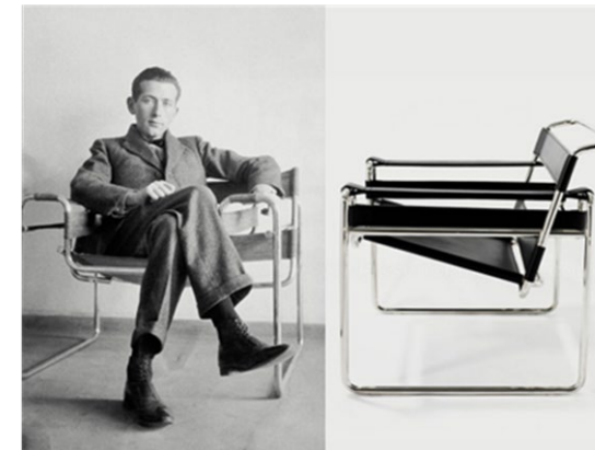
(Imagen pregunta 17)

PREGUNTA 18 Villa Saboya, Le Corbusier. Señale su cronología aproximada y comente las principales innovaciones arquitectónicas de esta obra. (1 punto)