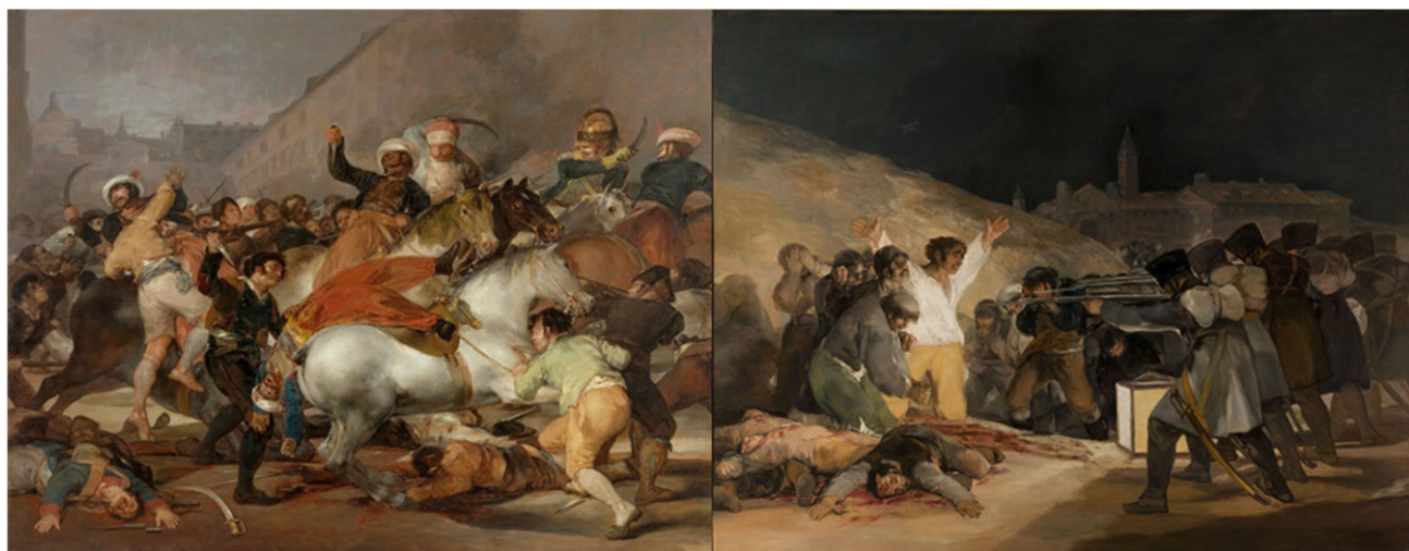
(Imágenes preguntas 1, 2 y 3)