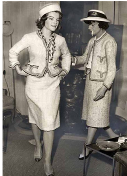
(Imagen pregunta 14)

PREGUNTA 15 “Madre migrante”, Dorothea Langue. Explique brevemente las características de la fotografía como documento social. (1 punto)