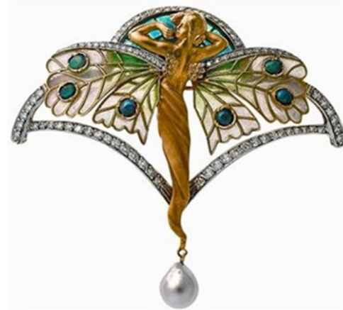
(Imagen pregunta 12)

PREGUNTA 13 “El profeta”, de Pablo Gargallo. Señale su cronología aproximada y comente las claves de la escultura de su autor. (1 punto)