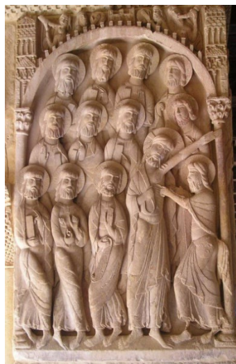
Pregunta 3 (2 puntos)