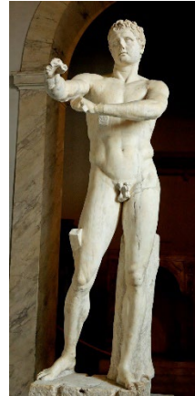
Pregunta 1 (2 puntos)