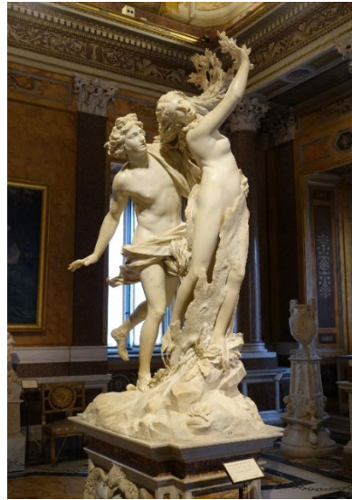
Pregunta 6 (2 puntos)