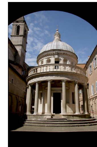
Pregunta 4 (2 puntos)