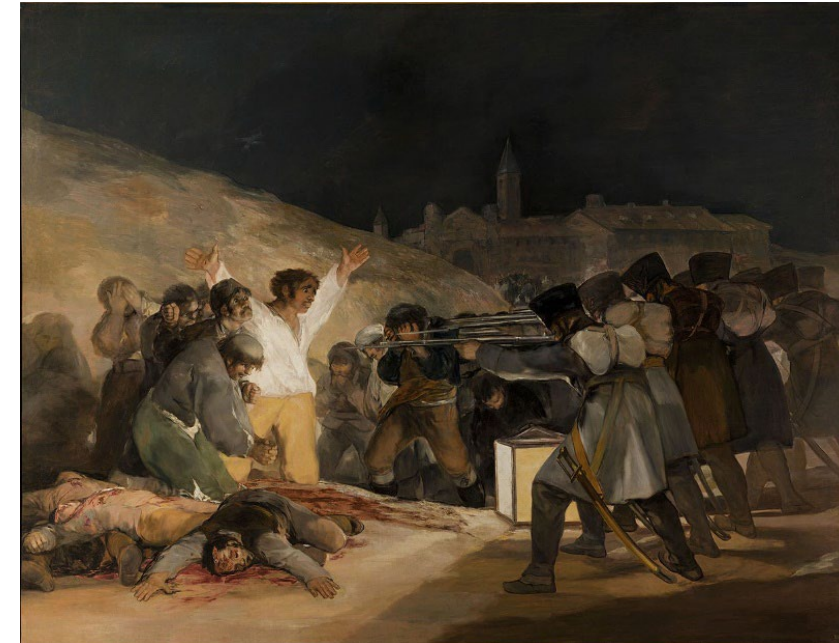
Pregunta 7 (2 puntos)