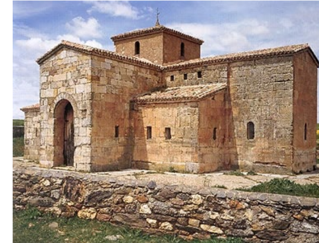
Pregunta 2 (2 puntos)