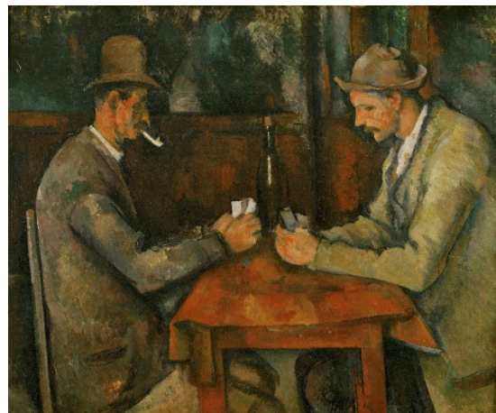
Pregunta 8 (2 puntos)