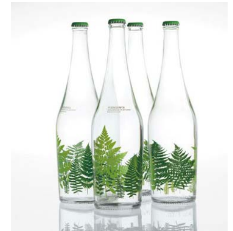
El texto dice: Fuensanta edición limitada Imagen 2

1- (Imagen 1) Analice la maquetación y el uso tipográfico de esta revista.