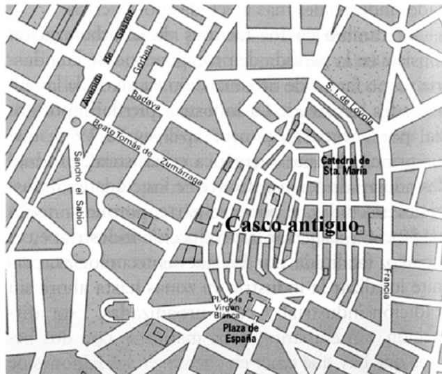
Plano de Vitoria-Gasteiz

C) Observe el plano de la ciudad de Vitoria. Señale sus características, diferenciando el casco antiguo del resto. (3 puntos)