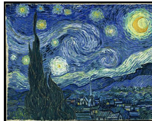
La noche estrellada, Van Gogh