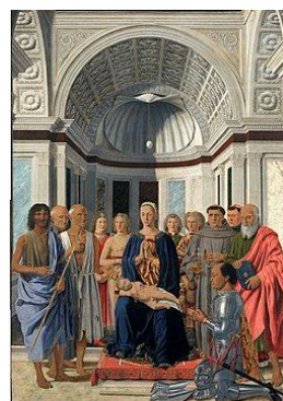
Madonna del Duque de Urbino, Piero della Francesca

Planta de cruz griega en origen, con incorporación de dos naves a los pies: resultado híbrido entre planta basilical y cruciforme. Disposición longitudinal en tres naves, con arcos formeros sobre pilares. Dos estancias a cada lado del chorus de función incierta. Capilla mayor de planta rectangular. Pérdida de la mayor parte de las cubiertas, excepto bóvedas de cañón en cabecera. Obra de cantería de talla regular, con sillería arenisca. Decoración escultórica: capiteles troncocónicos de columnas con escenas historiadadas de cuño bíblico; basas de columnas con Evangelistas; friso con ruedas solares, flores de doce pétalos, cruces y motivos geométricos.