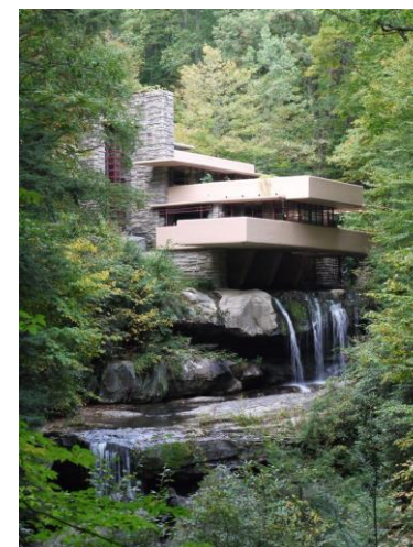
Casa Kaufmann, Wright

Óleo sobre lienzo. Reflejo del ambiente festivo parisino de Montmartre. Influencia de la fotografía: encuadre y plasmación de la fugacidad. Ejecución rápida, pincelada suelta. Vivacidad cromática. Captación atmosférica, interés por la luz, filtraciones de rayos solares e incidencia sobre el color.