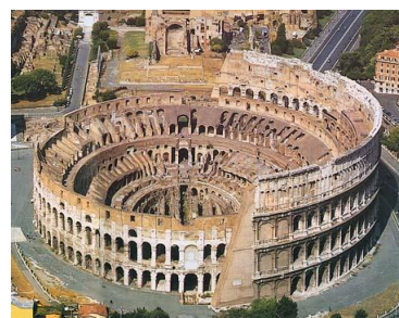
Coliseo de Roma