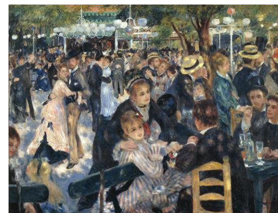
Le Moulin de la Galette, Renoir