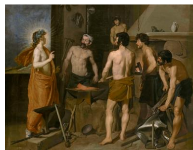
La fragua de Vulcano, Velázquez

Marco cronológico: siglos XI y XII. Sentido religioso y simbólico. Predominio de la escultura monumental, subordinada a la arquitectura. Función didáctica, adoctrinamiento. Rasgos formales: hieratismo, esquematismo, simplificación, tendencia al horror vacui, alteración de las proporciones, perspectiva jerárquica, desinterés por la captación del espacio, policromía. Iconografía basada en el Antiguo y Nuevo Testamento, resaltando la importancia de las visiones apocalípticas en las portadas de las iglesias. Otros temas: vidas de santos, motivos vegetales, animales fantásticos y elementos geométricos.